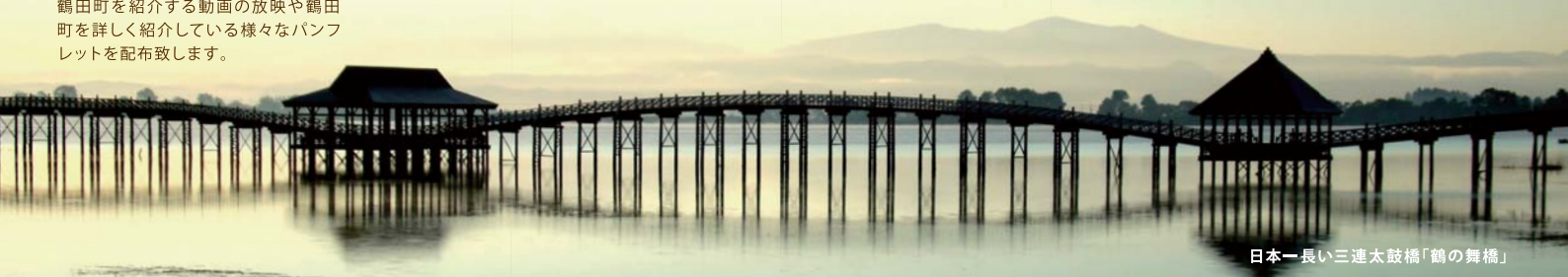
日本一長い三連太鼓橋「鶴の舞橋」

鶴田町を紹介する動画の放映や鶴田町を詳しく紹介している様々なパンフレットを配布致します。