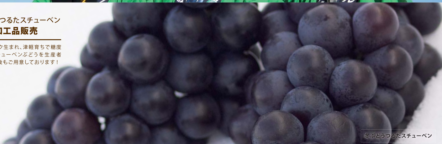
冬ぶどうつるたスチューベン

ニューヨーク生まれ、津軽育ちで糖度20度のスチューベンぶどうを生産者が直売。試食もご用意しております!