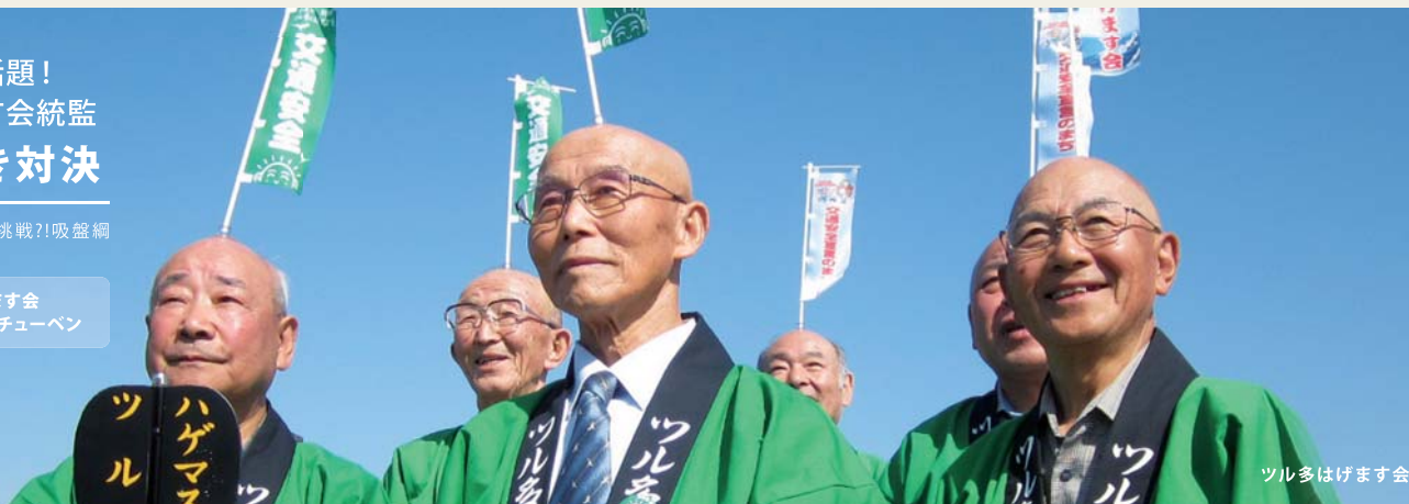
ツル多はげます会