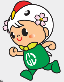
鶴田町マスコットキャラクター 「つるりん」